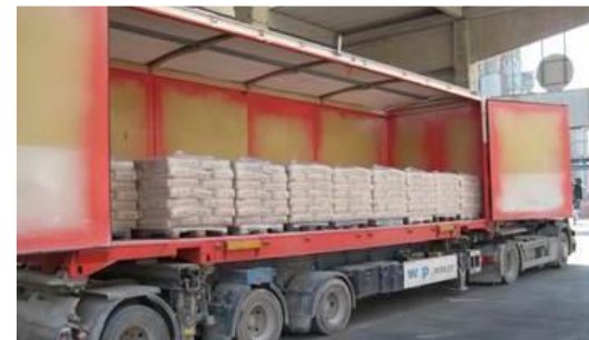
Multitainer 36 – H