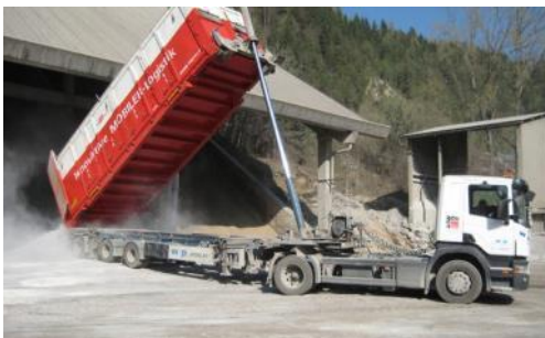
30 piedi Multitainer con Schüttgut