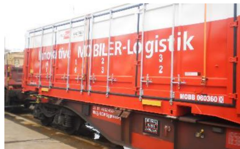
Multitainer 36 – K