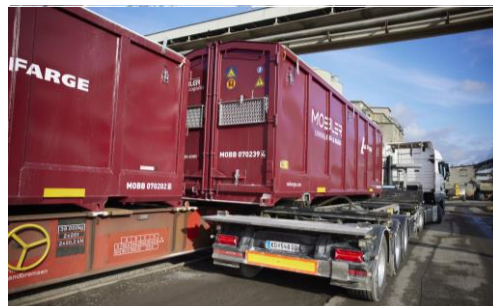
Container 30 piedi