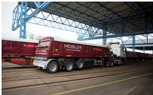
30 piedi Halftrailer